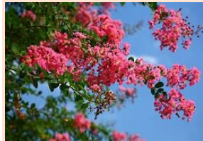
かみさぎ花だより

盛夏で昔から特に目立つのが百日紅か。この花は白もあるが燃え上がる赤が主…和名が「サルスベリ」。猿は木登りが上手だが、時には滑り落ちるほど樹皮が滑らかなところから、この名がつけられている。納得。さらに別名の謂われは、次から次へと花が咲く期間が長いことから百日紅「ヒヤクジツコウ」。これも十分に説得力あり……因みに中国でも百日紅と名付けられている、と。江戸時代前に渡来したと言われている。