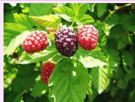
かみさぎ 花 だより