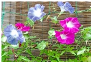
かみさぎ花だより

この花ほど現代の我々と密接に結び付いた花はないでしょう。小学生の夏休みの課題として朝顔の栽培と観察が今でも続いているのではないのでしょうか。朝顔は朝咲き、その後昼にはしぼんでしまう「朝美人」に例えられる儂き花。日本では奈良時代末、遣唐使が種を薬として持ち帰ったと言われています。朝顔の種は牽牛子(けんごし)と言い、粉末にして下剤や利尿効果のある貴重な漢方薬として重宝したようです。世界的に見てもこれほど形態が多種多様に变化した園芸植物は他にないと言われ、特に江戸時代に品種改良が進んだようです。これが発展して明治時代初期から入谷の朝顔市が始まりました。