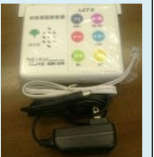
実物はハガキ大 (費用は無料)

駐在さんに取り付けてもらいました。詐欺防止のお話がとても分かりやすかったです。勧誘など迷惑電話もかからなくなりました。