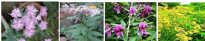
撫子(なでしこ) 藤袴(ふじばかま) 萩(はぎ) 女郎花(おみなえし)